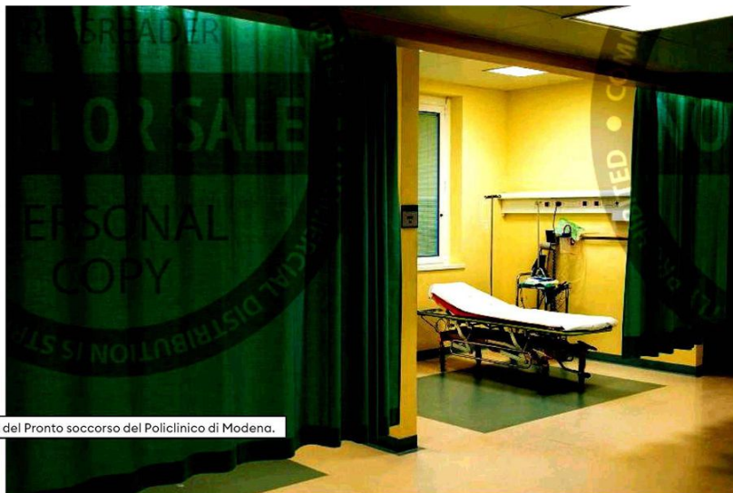
Uno dei box del Pronto soccorso del Policlinico di Modena.