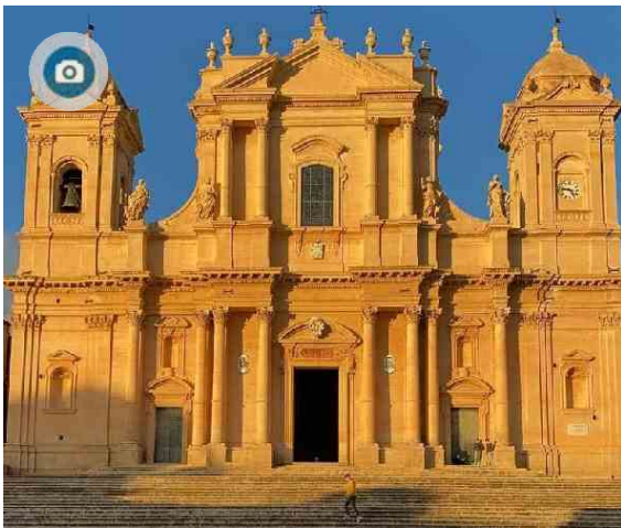
Sicilia, positivi per caso: ritorno in giallo a febbraio

L'unico auto-lockdown è per mezzo milione di no vax e 190mila quarantenati col vaccino